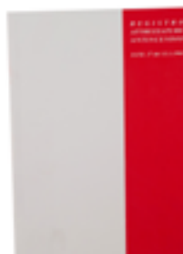
Registro antincendio UNI 9994-1:2013 Fire fighting equipment book: custom type