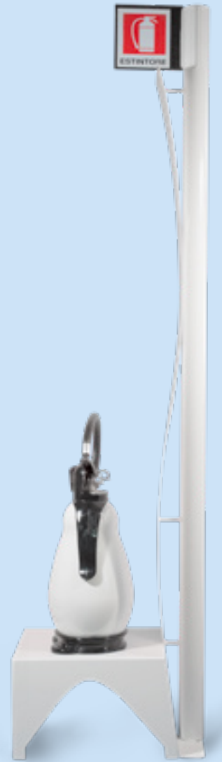
Seduta Upright Seduta