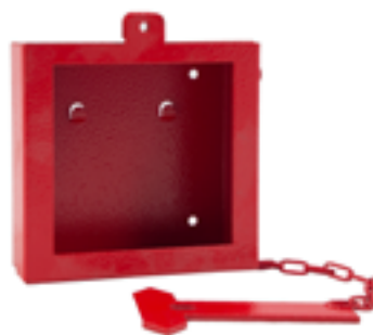
Cassetta portachiavi con martello Key cabinet with hammer