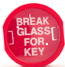
Cassetta portachiavi PVC Emergency Key Holder