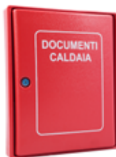
Cassetta portadocumenti locale caldaia Cabinet for boiler documents