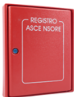
Cassetta portadocumenti ascensore Cabinet for lift documents