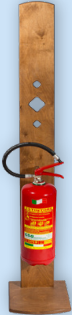
Porta estintore in legno Wood extinguisher holder