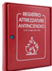
Cassetta portadocumenti Cabinet for documents