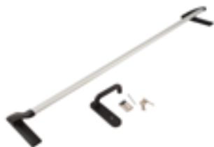
Maniglione antipanico con maniglia Twist