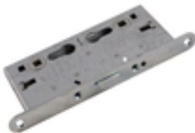
Serratura anta primaria porta antipanico