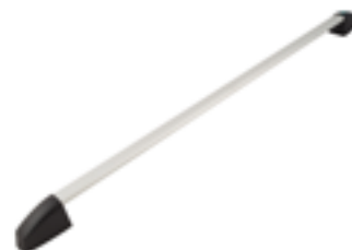
Maniglione antipanico mod. Slash