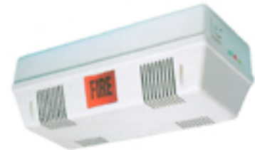
Centralina alimentazione C1 completa di batteria tampone