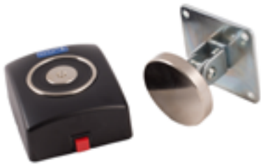
Elettromagnete a parete