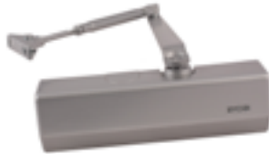
Chiudi porta a molla per porta tagliafuoco

Articolo Item Codice Code Descrizione Description 9045 CPS Con braccio a compasso 9046 CPG Con guida di scorrimento