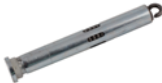
Spinotto per cerniera a molla