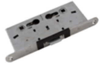
Serratura anta primaria standard

Articolo Item Codice Code Descrizione Description 9045 CPS Con braccio a compasso 9046 CPG Con guida di scorrimento