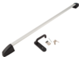
Maniglione antipanico con maniglia Slash