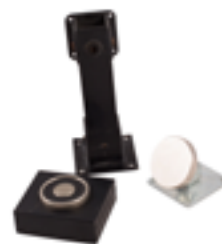
Elettromagnete a pavimento