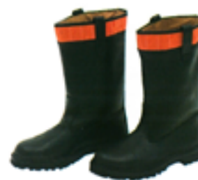
Stivali di cuoio tipo V.V.F