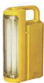
Lampada di emergenza a batteria