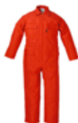
Tuta in cotone ignifugato