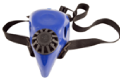
Semimaschera in gomma