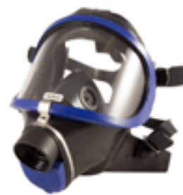
Maschera pieno facciale