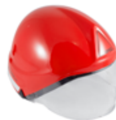
Casco per operatore antincendio