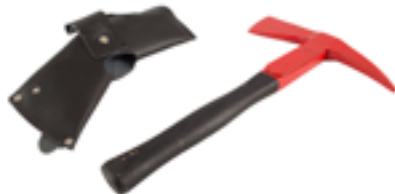
Piccozzino con custodia