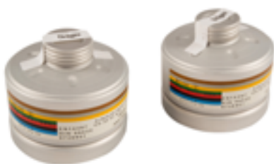
Filtro per maschera (CO2)