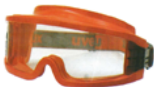
Occhiali per operatore antincendio