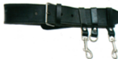
Cinturone di posizionamento