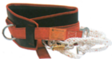
Cinturone per squadra antincendio