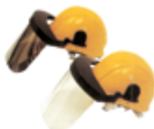
Elmetto con sottogola in policarbonato con visiera