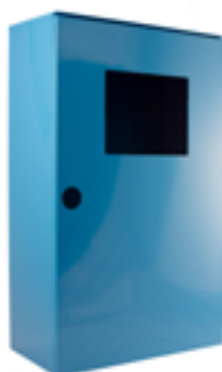
Cassetta per autorespiratore